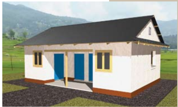
BWBs Halmballehus Design.

BWBs designs er jordskælvssikre. Hjem og offentlige bygninger såsom skoler og medborgerhuse skal være jordskælvssikre, hvilket gør BWBs løsninger afgørende for at beskytte Nepal mod fremtidige tragedier. Designene udviser også overlegne termiske kvaliteter hvilket er livsnødvendigt i et land med verdens højeste bjergtinder.