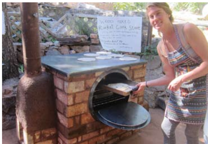
Færdigt Raket Komfur efter 4 formiddages hands-on workshop – køkkenholdet tager straks Raketkomfuret i brug (se særskilt artikel)

Arrangementgruppen er meget erfaren, for det er en stor kunst at organisere 170 virksomme, aktive mennesker, som alle viser det bedste, de kan omkring Natural Building i 8 dage. Det er også en stor udfordring for de deltagende, at byde ind på aktiviteter. Efter lidt ”frem og tilbage” landede vi på en hand-on workshop med Flemmings nye design til et effektivt brændefyret komfur: Raket Komfuret.