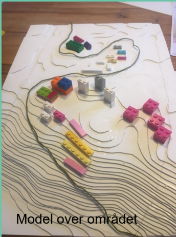
Model over området

Foreningen Bæredygtig bydel står bag planer om at etablere en bydel i udkanten af Vejle i løbet af de næste 5 - 7 år. Vi har behov for at beskrive og udvikle måleredskaber til kommende kommuneplan, lokalplan, investorer, boligselskaber og andre samarbejdspartnere. Derfor samler vi fagfolk fra hele landet til en åben debat, hvor vi deler vores viden og erfaringer om, hvad der er muligt og hensigtsmæssigt inden for selve byggeriet.